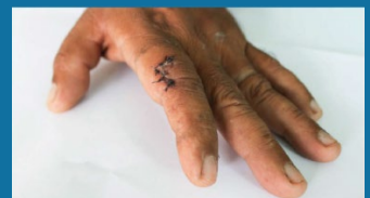
Vết thương không được bảo vệ hoặc bị nhiễm trùng